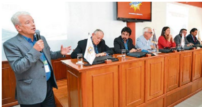
Misión internacional INTA. Reflexiones sobre nueva visión urbano-regional en Arequipa a propósito de proyecto Majes Sigwas II, en virtud de Convenio de Cooperación Gobierno Regional-CAPECO.