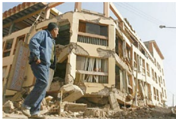
Un sismo en Lima similar al de Pisco, provocaría 51 mil muertos y la destrucción de 549 mil viviendas por la informalidad de las construcciones.

De otro lado, un reporte técnico publicado en el Informe Económico de la Construcción de CAPECO en julio 2018 estimó que aproximadamente el 25% de la inversión inmobiliaria en vivienda y que el 38% de las compras de materiales de construcción corresponde al segmento informal. Un estudio del mercado informal de vivienda desarrollado por Arellano Marketing para CAPECO en 2013 estimó que solo en Lima Metro-