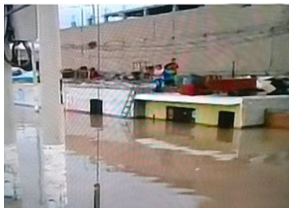
Familia guareciéndose encima de casa Techo Propio – Sitio Propio que resistió inundación durante el Niño Costero en Huarmey. Pero el programa debe fortalecerse

En teoría, la actividad constructora tiene una completa regulación que garantiza el cumplimiento de las