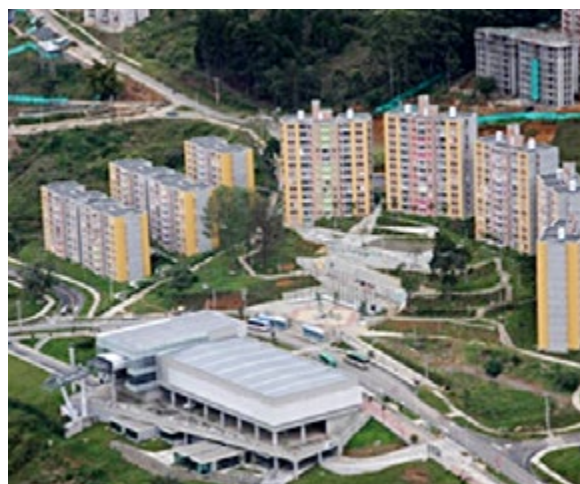
Villa Suramericana, Medellín. Intervención integral en zonas de laderas que incluye vivienda social multifamiliar, mejoramiento de barrios del entorno y transporte público a través de teleféricos.

El empleo de materiales falsificados, que se fabrican informalmente y que incumplen normas técnicas se encuentra extendido en las familias de bajos ingresos e inclusive en los programas estatales de vivienda y