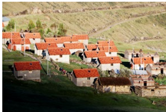
Proyecto Techo Propio en Comunidad Campesina de Yanamayo, Cusco. Rompiendo prejuicios, el sector privado regional provee viviendas sociales en áreas rurales.