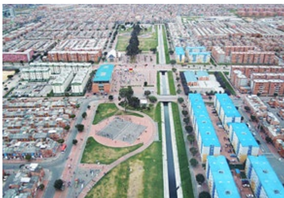
Ciudadela El Recreo, Bogotá: empresa pública de suelo promoviendo la generación de suelo para proyectos habitacionales en alianza con promotores privados. Un modelo a replicar.

El proceso de descentralización puesto en marcha en 2002 encargó la planificación y gestión territorial a las municipalidades, pero existen muchas debilidades