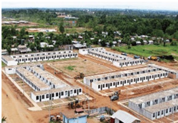
Proyecto Municipal Ucayali en Pucallpa. Modelo de coinversión pública-pública para proveer de servicios de agua y desagüe a proyectos inmobiliarios de vivienda social.

constituirá sobre la base del Instituto Metropolitano de Planificación.